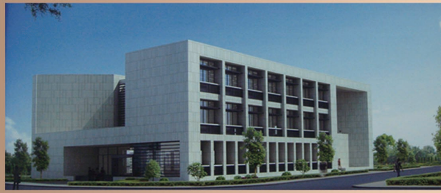
浙江工商大学日本文化研究楼

本院一直积极开展国际学术交流活动。目前已与日本早稻田大学、神奈川大学等8所海外大学签订了院（所）级学术交流协议，与日本东京大学、京都大学、国际日本文化研究中心、文部科学省国文学研究资料馆、日本大学、法政大学、关西大学、韩国高丽大学、江源大学、美国哥伦比亚大学等保持着密切的学术交流关系。除了不定期派遣本院专职研究人员出国讲学、考察、开会、进修，定期派遣研究生赴日本留学之外，还每年推荐优秀硕士毕业生赴日本免试攻读博士学位。